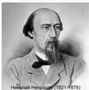
Николай Некрасов (1821-1878)

Министерство культуры и архивов Иркутской области Иркутская областная детская библиотека им. Марка Сергеева