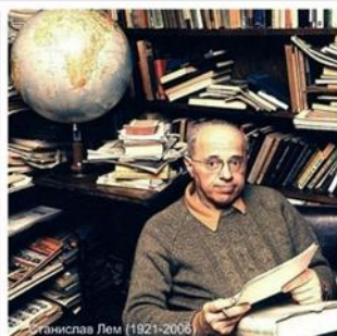
Станислав Лем (1921-2006)