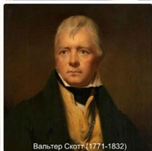
Вальтер Скотт (1771-1832)