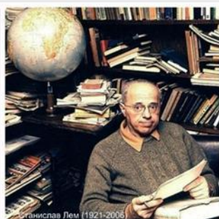
Станислав Лем (1921-2006)