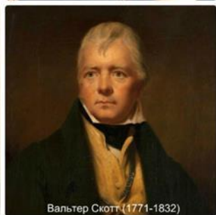
Вальтер Скотт (1771-1832)