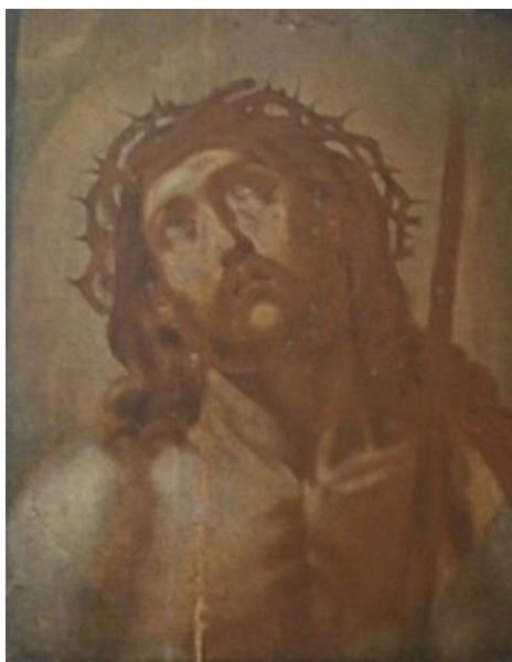
Икона Иисуса Христа