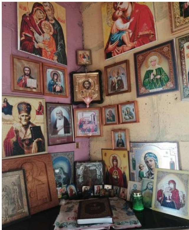
Красный угол нашей семьи