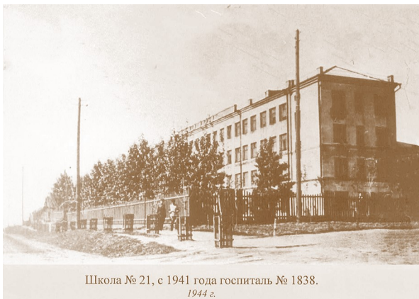
Школа № 21, с 1941 года госпиталь № 1838. 1944 г.

«Тогда полыхало мирное предвоенное солнце, млело чистое надёжное небо, стелилась у ног нежная утренняя трава, и девочки подносили к каждому из нас годовалые топольки, ставили их