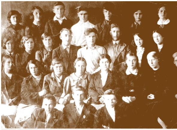
Ученики 10 класса выпуска 1941 года, посадившие тополя.

История тополиной аллеи в Иркутске началась за две недели до Великой Отечественной войны, в июне 1941 года. Старшеклассники школы № 21 на улице Коминтерна (сейчас это ул. Байкальская), высадили перед зданием 26 тополей.